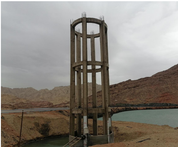
图 1 排洪系统排水井外观照