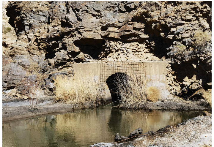
图 2 排洪系统隧洞外观照