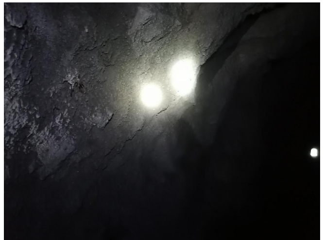
图 3.2.2.2-4 隧洞内部混凝土喷护