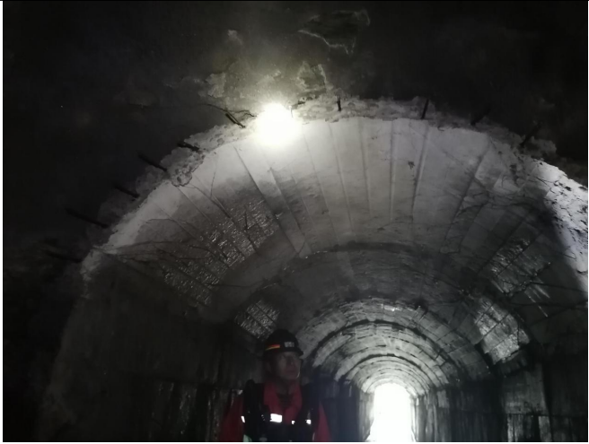
图 3.2.2.2-1 隧洞洞口拱顶混凝土衬砌