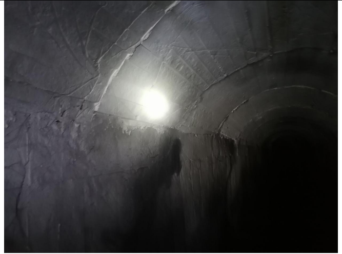
图 3.2.2.2-2 隧洞洞口拱顶混凝土衬砌