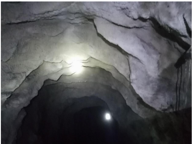
图 3.2.2.2-3 隧洞内部混凝土喷护