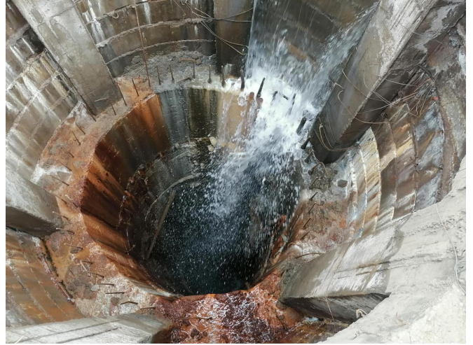
图 3.2.2.1-2 排洪系统排水井