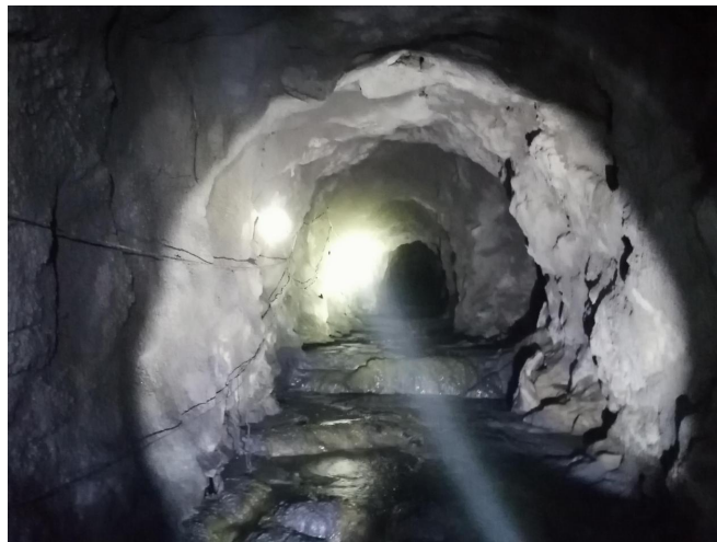
图 3.2.2.1-3 排洪系统隧洞