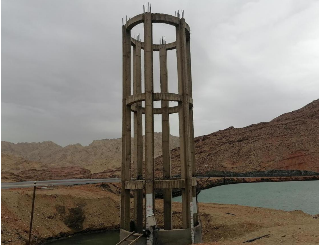
图 3.2.2.1-1 排洪系统排水井